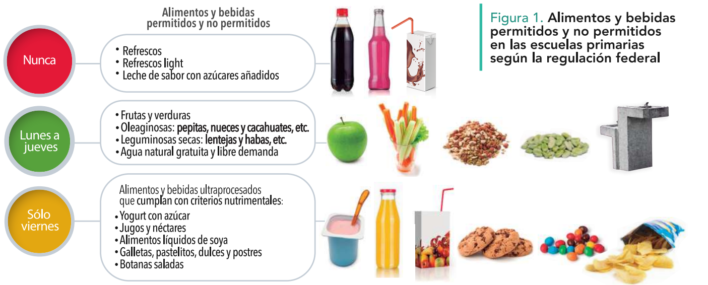
Figura 1. Alimentos y bebidas permitidos y no permitidos en las escuelas primarias según la regulación federal